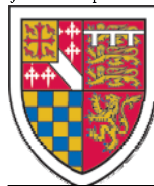
St. Edmund's College

Filozofski fakultet želi Miliji sve najbolje, uz poruku da će za njega naša vrata uvijek biti otvorena.